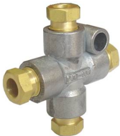
Cruzeta com fixação para Ø4mm