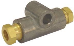
União tubo x tubo para Ø4mm