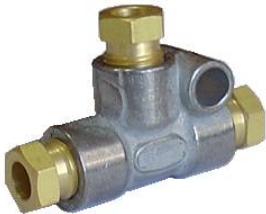
Tee com fixação para Ø4mm