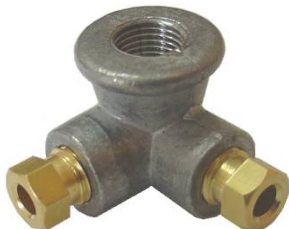
Tee 90° para tubo Ø4mm